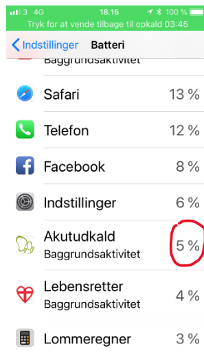
Strømforbrug målt på en uge

Målingen på de 24 timer er uden udkald. Typisk vil strømforbruget stige til 5%, såfremt man bliver kaldt ud.